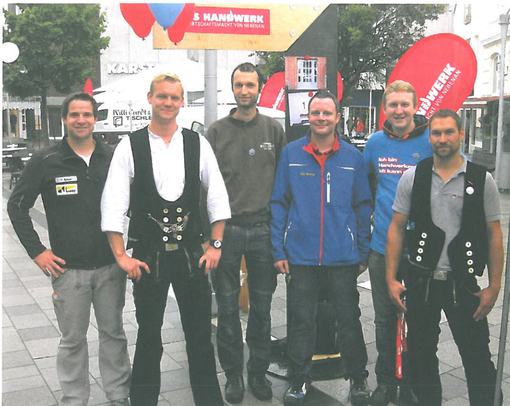
Die Jungmeister vor ihren Infoständen