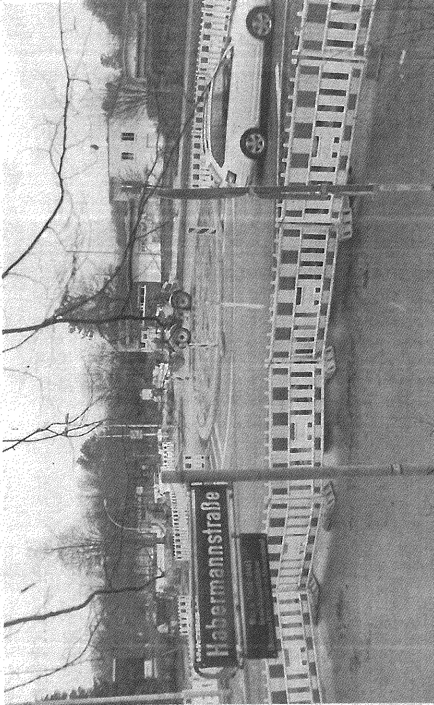
Hier an der Habermannstraße/Ecke Binnenfeldredder ist der erste Kreisverkehr entstanden. Der zweite Kreisverkehr schließt am Röpredder an – von hier aus ein Stück weiter rechts in Richtung Reinbek.

Das „Praktikumsrundell“ ist eine Initiative der Betriebsjunioren Bergedorf, dem Zusammenschluss junger Meister und Handwerker in Führungspositionen. Aus ihrer Idee, Schülerpraktikanten die ganze Bandbreite des Handwerks zu zeigen, statt nur einen Beruf, ist ein rotierendes System geworden: Die Praktikanten bewerben sich bei einem der Bergedorfer Betriebe, lernen in ihren drei Praktikumswochen aber bis zu fünf Firmen verschiedener Gewerke kennen. Die Organisation dieser „Rundreise“ mit drei Tagen pro Handwerk übernimmt das Unternehmen, bei dem sich der Praktikant beworben hat.